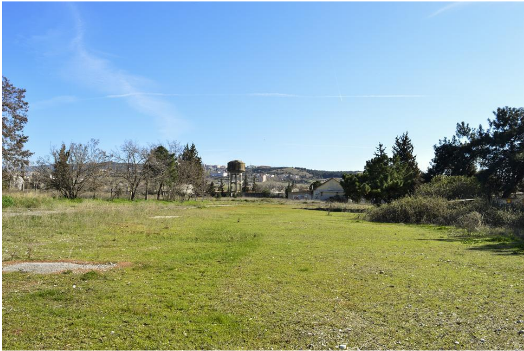
Εικόνα: Σοφία Λαμπρινοπούλου

Η Parallaxi έχει καλύψει το ανοιχτό ζήτημα διαχρονικά και μπορείτε να βρείτε ΕΔΩ αρκετά από τα θέματα που έχουμε κάνει στο παρελθόν. Μάλιστα, στη συνέχεια παραθέτουμε σε αυτό το κείμενο το χρονικό της διεκδίκησης από τους πολίτες και το ιδιοκτησιακό καθεστώς του Καρατάσιου από το 1915 μέχρι σήμερα.