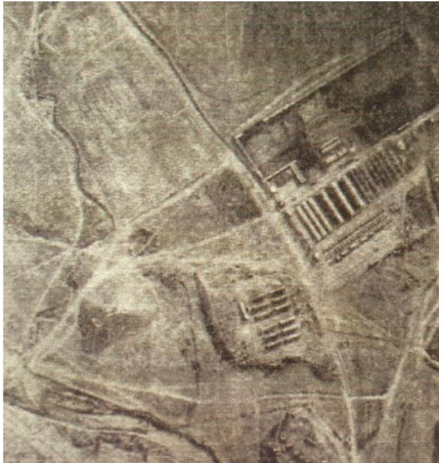
Αεροφωτογραφία του 1916 του αρχαιολόγου L.Ray / Το πρώην στρατόπεδο Καρατάσιου πριν από έναν αιώνα

Την περίοδο αυτή και όπως γνωρίζουμε από διάφορες πηγές οι σύμμαχοι είχαν κατασκευάσει εκτεταμένες εγκαταστάσεις μετατρέποντας όλη τη διαθέσιμη περιφερειακή γη σε ένα απέραντο στρατόπεδο που τα βορειοδυτικά του όρια πρέπει να βρίσκονταν σε αυτή περίπου τη θέση.