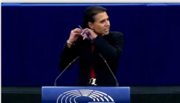
«Γυναίκα, Ζωή, Ελευθερία»: Ευρωβουλευτρια έκοψε την αλογοουρά της μέσα στο Ευρωκοινοβούλιο