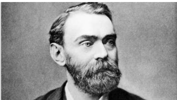
Ο Άλφρεντ Νόμπελ ως «έμπορος θανάτου» και τα βραβεία