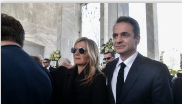
Πέθανε ο πατέρας της Μαρέβας Γκραμπόφσκι - Μητσοτάκη